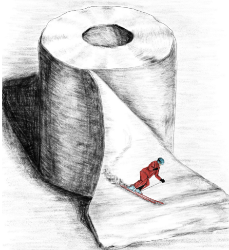
Beispiel Aufgabe 2

Überlege dir einen Gegenstand den du in/ an/ um die Rolle positionieren kannst, der etwas völlig Neues aus der Rolle Toilettenpapier macht. Dabei darf dieser Gegenstand völlig unrealistisch sein, auch die Grössenverhältnisse spielen keine Rolle (siehe Beispiel Skifahrer). Lass dich von der Form der Rolle und des Papiers inspirieren und finde dazu einen passenden Gegenstand/Tier/ Sonstiges. Wenn du eine Idee hast, fertige davon Entwürfe für dein späteres farbiges Bild an. Wähle den Entwurf aus, welcher dir am besten gefällt und mache daraus ein farbiges Bild, beziehe auch den Hintergrund mit ein. Achte dabei auf eine fein abgestimmte Farbigkeit, die auch nicht realistisch sein muss, aber mit möglichst unterschiedlichen Farbtönen (auch Buntstifte kann man mischen).