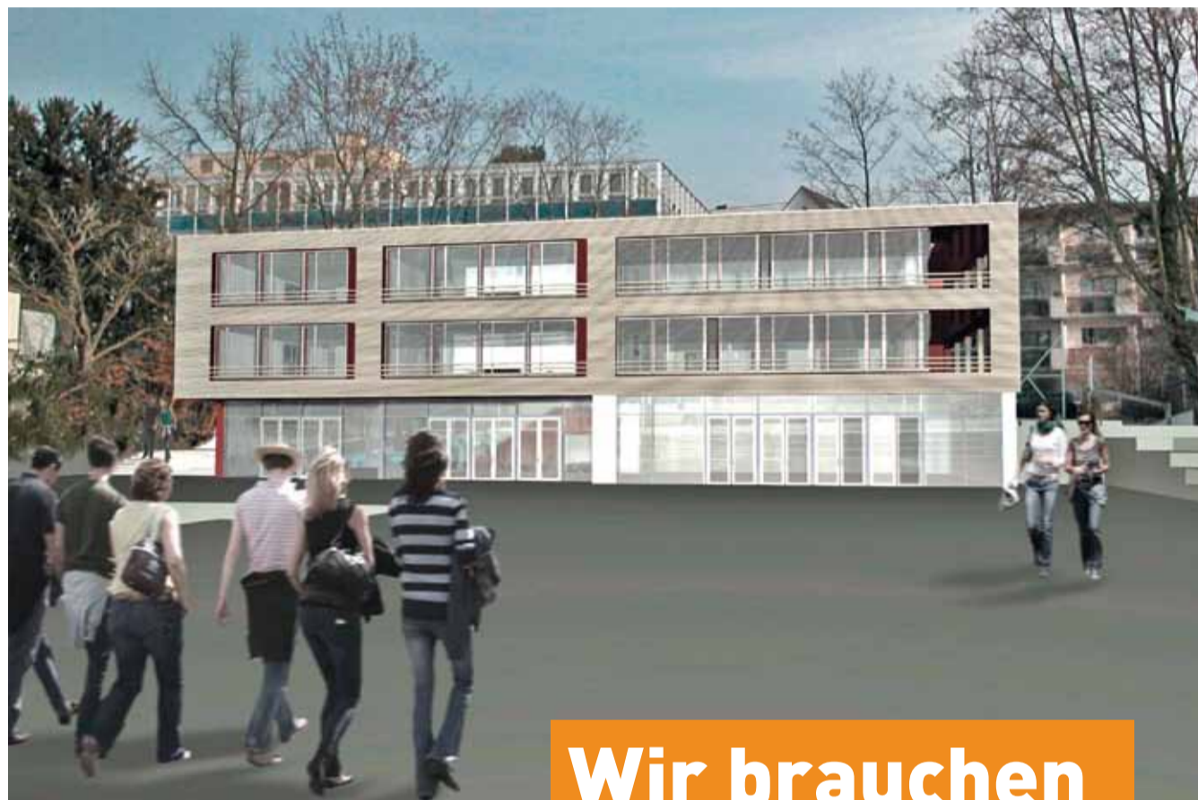
Oben: Frontansicht vom Park aus gesehen.