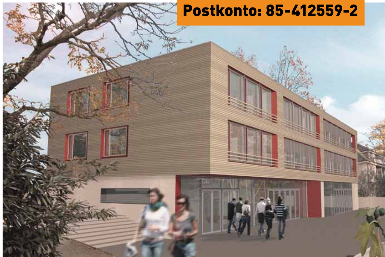
Unten: Der Neubau hat einen eigenen Charakter – bescheiden und ökologisch.