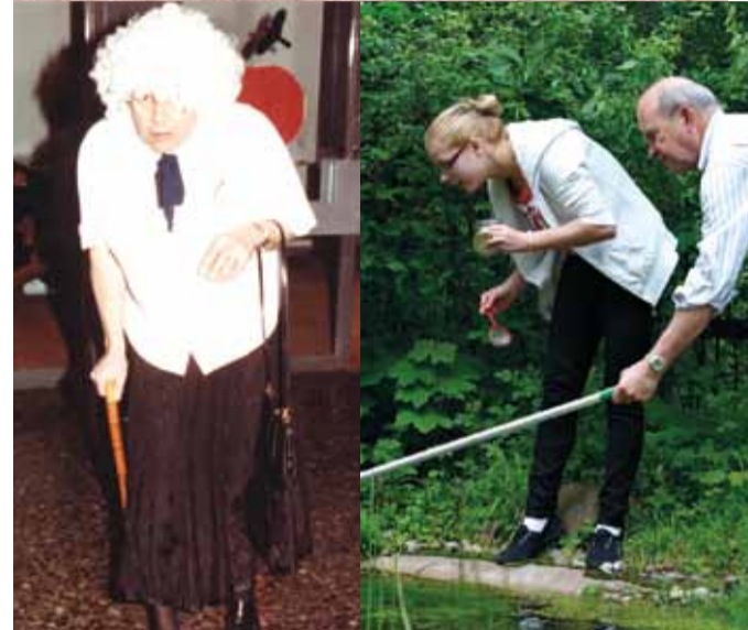
Semifest März 1991